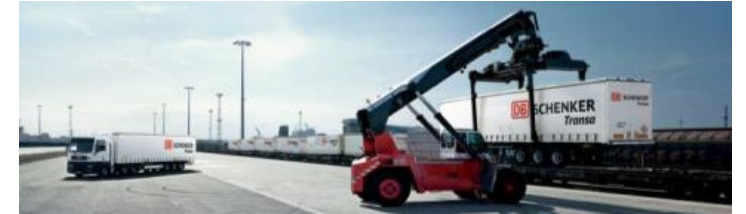
Güterverkehr und Logistik